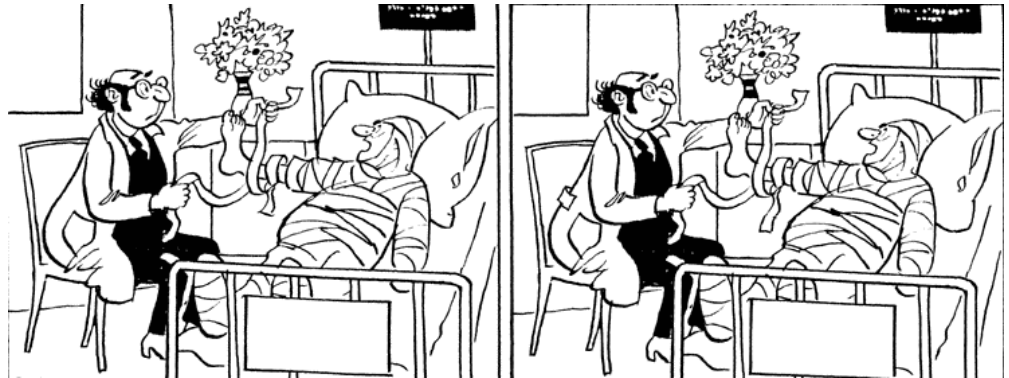
Im rechten Bild sind 5 Fehler versteckt. Viel Spaß beim Suchen ©

4. Endposition: Um die Atemwege frei zu halten, den Kopf des Bewusstlosen überstrecken und mit dessen unter der Wange liegenden Hand fixieren. Seinen Mund leicht öffnen. Da dieser nun zum tiefsten Punkt des Körpers geworden ist, wird sichergestellt, dass der Betroffene nicht an Blut, Erbrochenem oder seiner eigenen Zunge erstickt.