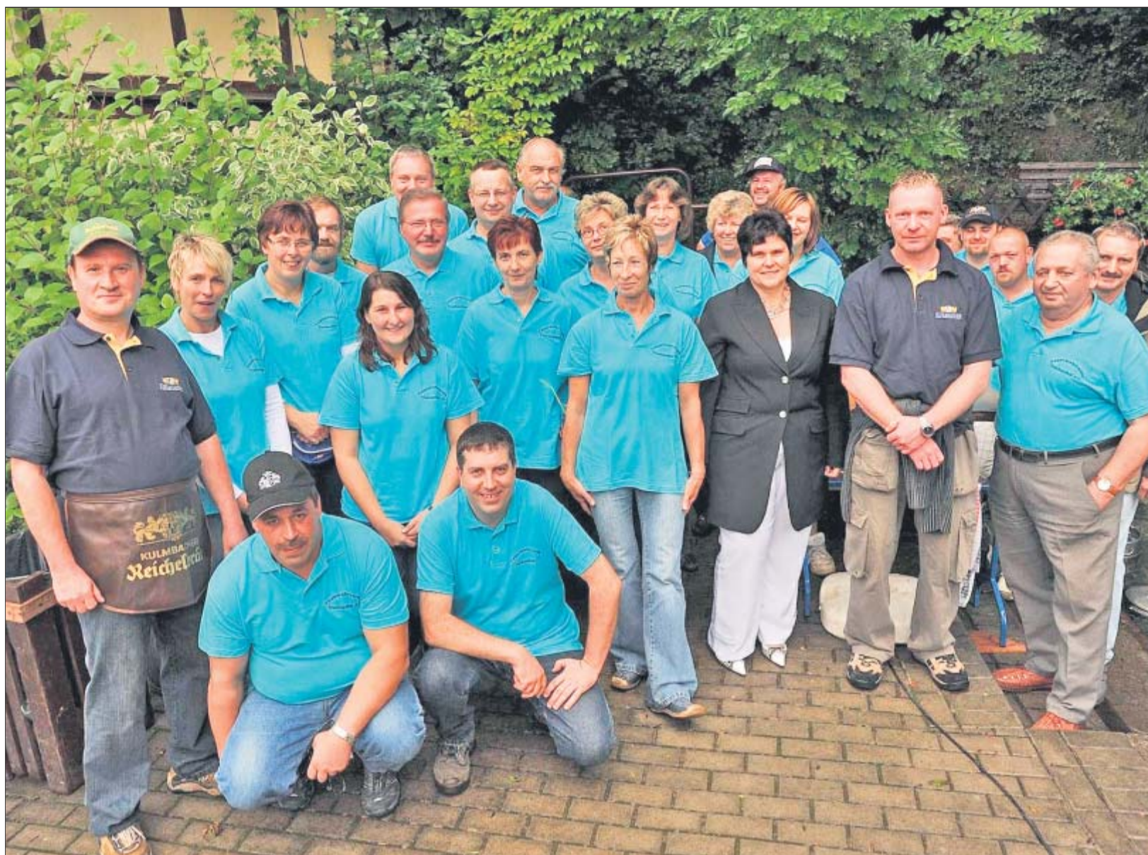
Die Mitglieder des Feuerwehrvereins Truckenthal trotzten am Sonntagnachmittag den Wolkenbrüchen. Trotz des vielen Wassers von oben fiel so das alljährliche Quellfest nicht ins Wasser.